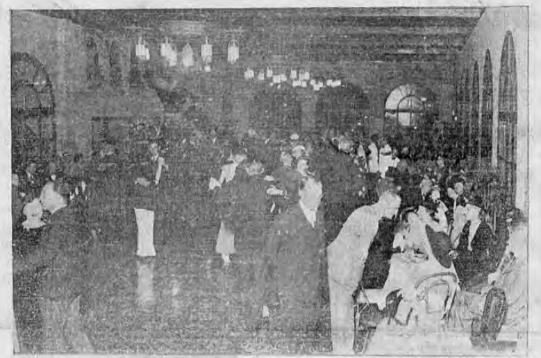
NO OLVIDE PARA SU MAYOR CONVENIENCIA, SEPARAR SU MESA PARA LA CENA DANZANTE DEL 31

Cerveza LEONA para el buen paladar — Pida esta exquisita cerveza, de precio popular, y la tomará siempre —